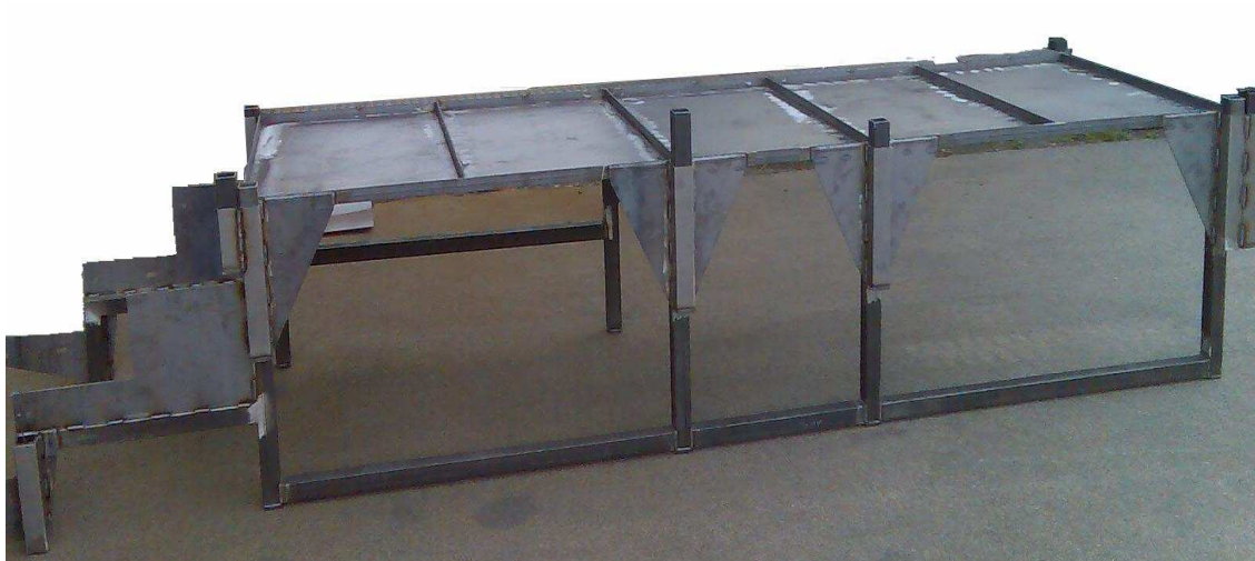
Schweisbaugruppen, hier Bedienpodest