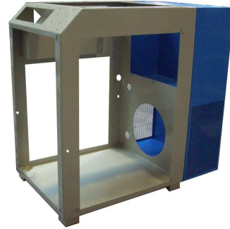
Maschinenumhausungen, z.B. Kompressorgehäuse