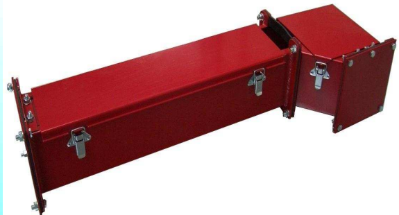
IP 54 – Kanal